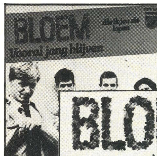
BLOEM SINGLE 6017 104