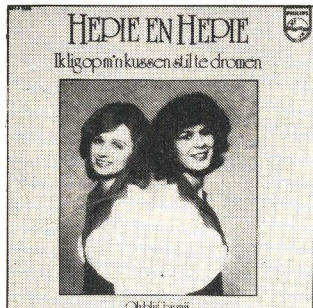
HEPIE EN HEPIE SINGLE 6017 034