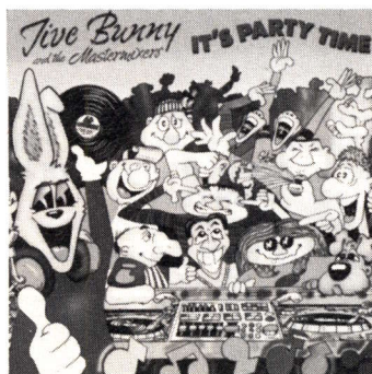
OP CD EN MC